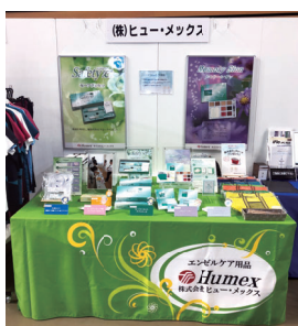
▲弊社のブースです